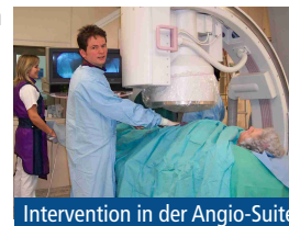
Intervention in der Angio-Suite